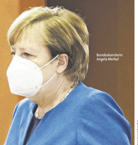
Bundeskanzlerin Angela Merkel