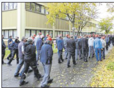
Protest bei Syntegon.