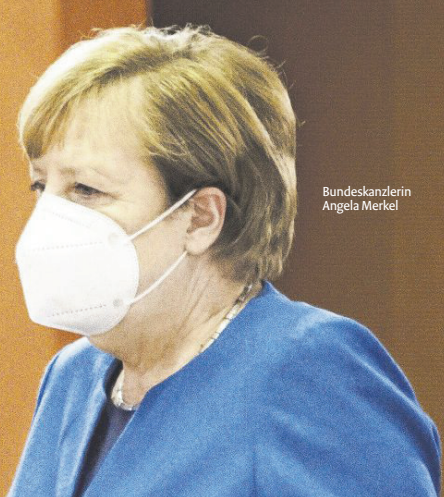
Bundeskanzlerin Angela Merkel