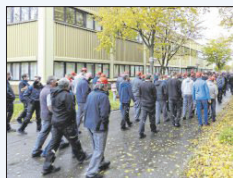
Protest bei Syntegon