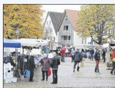
Markt mit Maske.