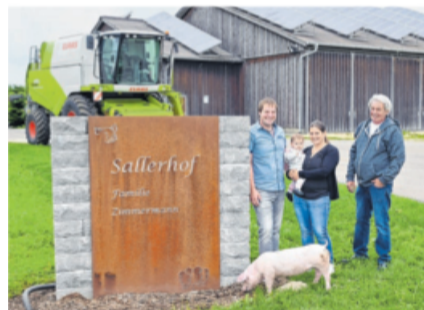
Familie Zimmermann investiert ins Tierwohl.