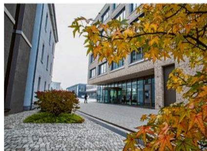
Der erste Teil der Stadtpromenade von Teamviewer bis Haus Gutmann.

Göppingen. Die Kanalstraße zwischen dem Göppinger ZOB und der Firma Teamviewer wird zur „Stadtpromenade“. Der erste Teil ist sogar schon fertig – ganz ohne Beschluss. GÖPPINGEN UND SCHURWALD Seite 17