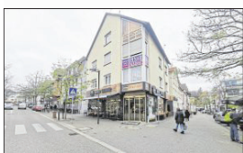
Ecke Untere Lindenstraße.