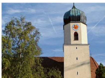
Da musste der Fachmann ran: Ringingens Kirchturmuhren stand still.

Ringingen. Ein Blitz hatte in den Ringinger Kirchturm eingeschlagen. Die Zeit ruhte, kein Glockenschlag war mehr zu hören. Nun die gute Nachricht: Es schlägt wieder. Burladingen Seite 19