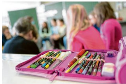
Mäppchen, Hefte und Co. gehen ins Geld.

Region. 80 bis 100 Euro kommen schnell zusammen, wenn Eltern Schulmaterial für ihr Kind kaufen müssen. Wer mehrere Kinder hat, kann sich leicht ausrechnen, wie groß das Loch in der Familienkasse wird. Region Seite 23