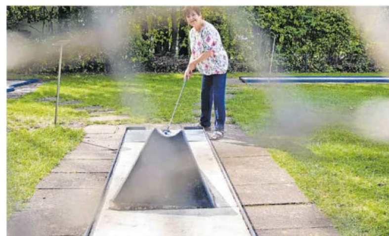
Minigolf ist spannend und braucht viel weniger Platz.

Hechingen. Wie wäre es denn mal mit den kleinen Bällen und dem Golfplatz im Miniaturformat? An diesem Sonntag, 11. September, findet auf der Minigolfanlage des Hechinger Rapphofs das 14. Jedermannturnier des 1. Minigolf-Clubs Hechingen statt. Mitmachen können also auch alle, die nicht Mitglied sind. Bereits am Samstag, 10. September, ist freies Training fürs Turnier. Gespielt wird in verschiedenen Kategorien über drei Runden. Wegen des Turniers ist die Rapphof-Anlage am Sonntag bis gegen 16 Uhr nicht bespielbar. Zuschauer sind jederzeit willkommen!