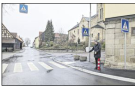
In der Ortsmitte.