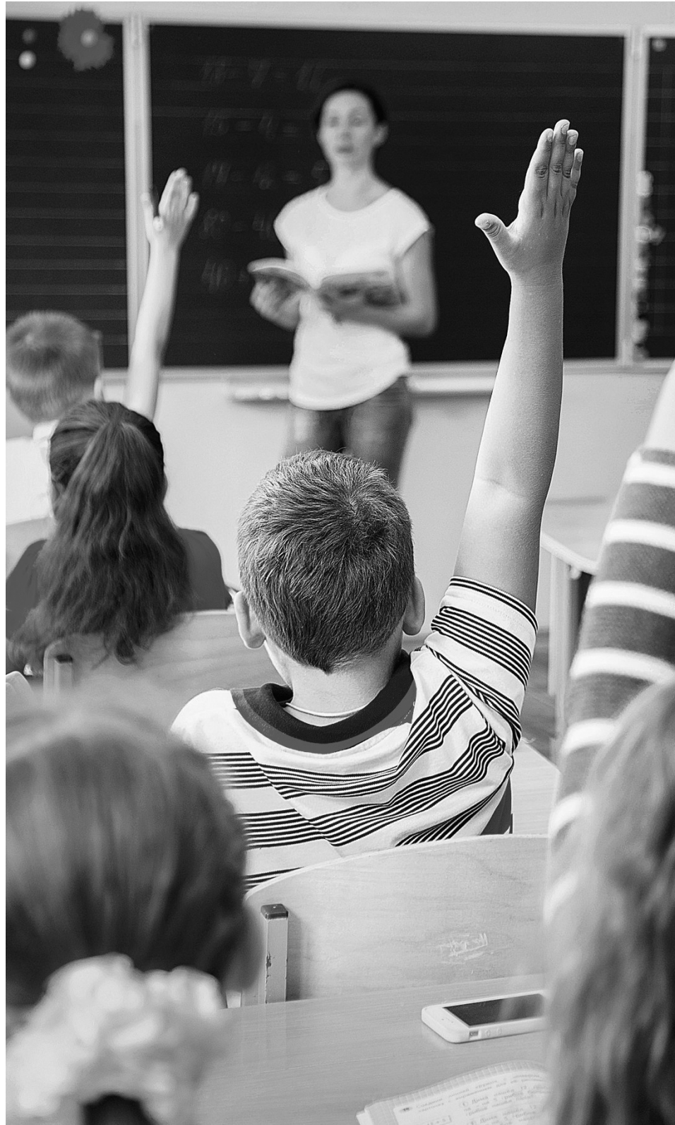
Die Mehrheit sieht die hohen Anforderungen des Lehrerberufs.

Bildung und Erziehung sind laut den Erwartungen der Baden-Württemberger keine Frage von Entweder-Oder. Schulen müssen aus ihrer Sicht beides leisten. Ganz weit oben in der Prioritätenliste stehen dabei auch im Computer- und Internetzeitalter Allgemeinbildung, Rechtschreib- und Grammatikkenntnisse sowie gutes Englisch. Mathe liegt