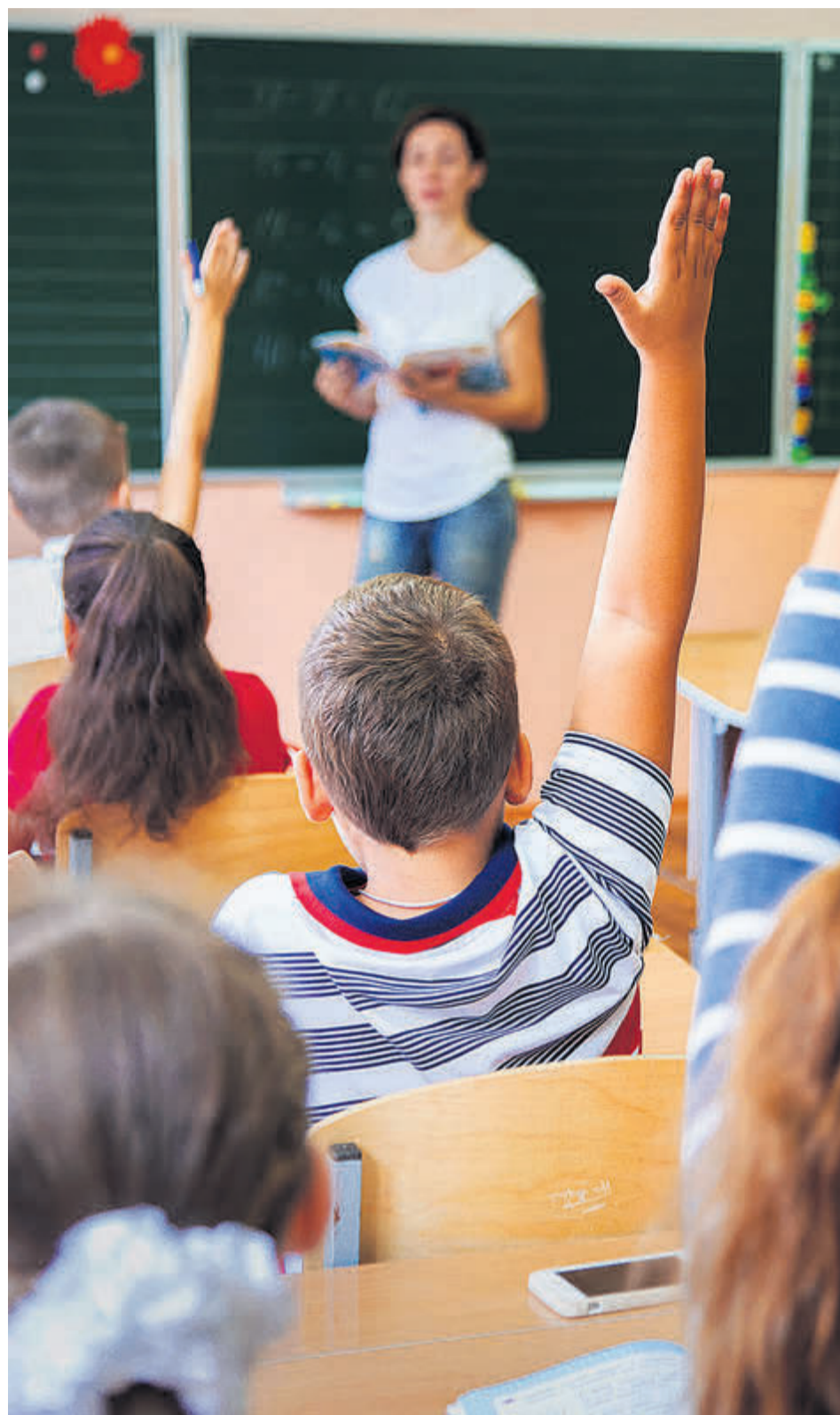
Die Mehrheit sieht die hohen Anforderungen des Lehrerberufs.