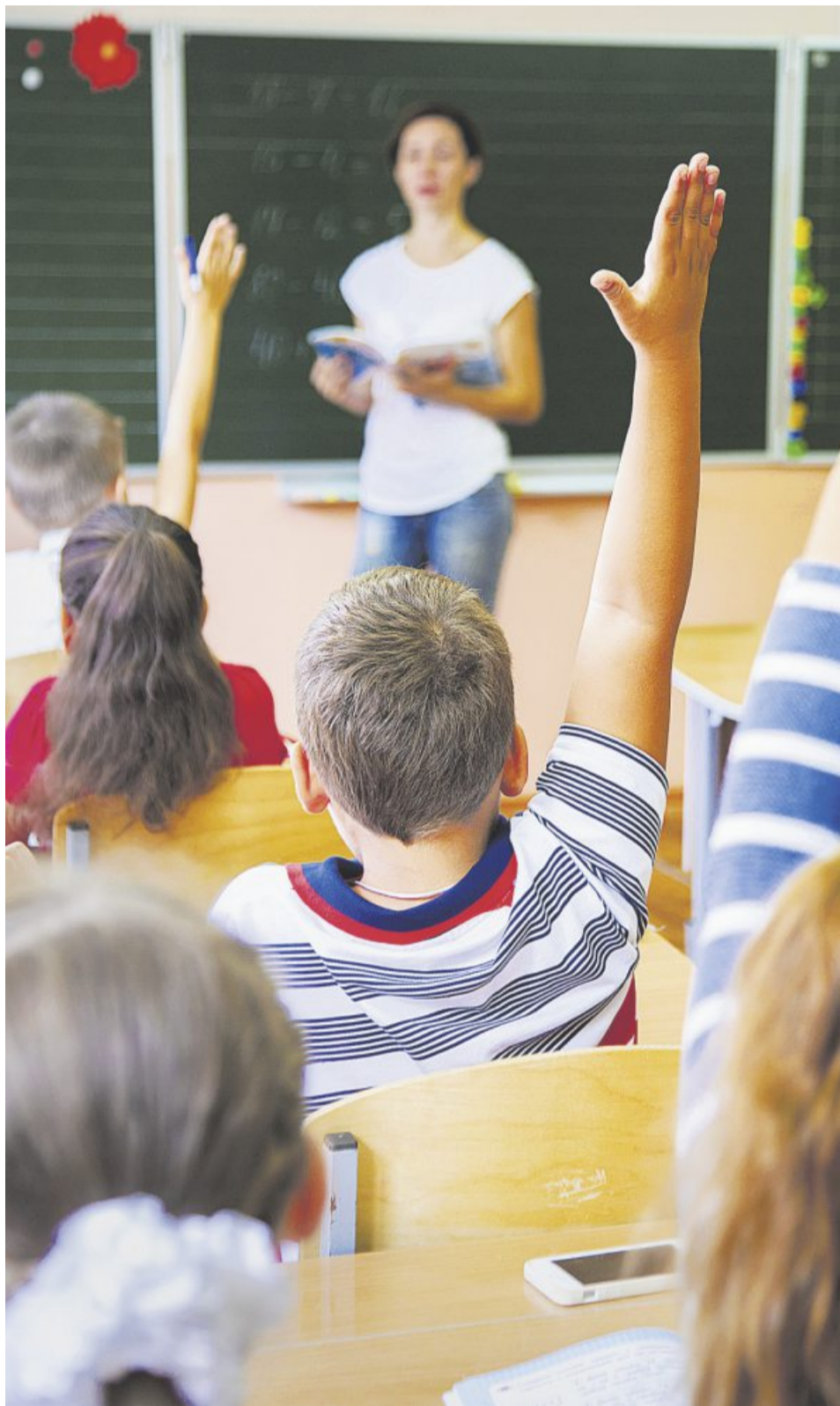
Die Mehrheit sieht die hohen Anforderungen des Lehrerberufs.