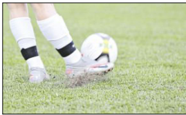
Fußball-Event am Samstag.