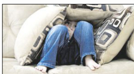
Nach einem Streit mag sich ein Kind schon mal verkriechen.