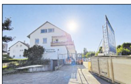
Der Ex-Getränkemarkt