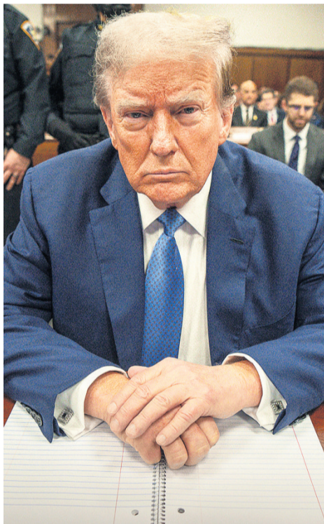
Die Strafverfahren gegen ihn hat Donald Trump nicht vergessen.

Etwa ein pensionierter Offizier der US-Armee, der bekannte, er habe noch am Wahlabend den Koffer gepackt. Weil seine Vorfahren aus Italien eingewandert waren, bemüht er sich jetzt um die italienische Staatsbür-