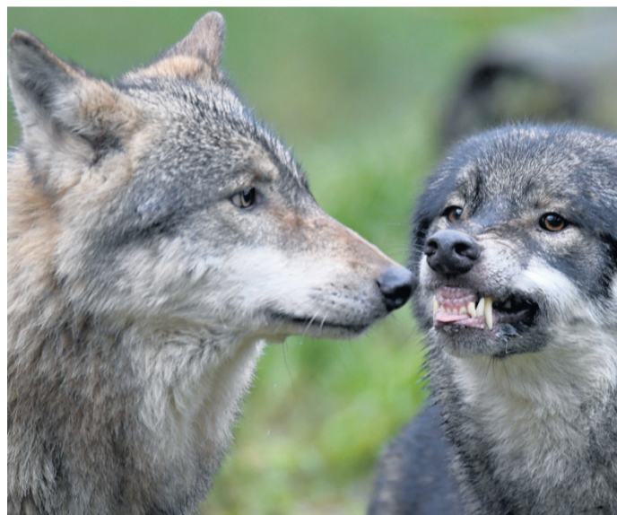
Die Wolfsbestände haben sich in Westeuropa in den vergangenen Jahren erholt.

Der Umweltschutzverband Nabu rügte, die Entscheidung des Europarats basiere nicht auf Fakten, sondern sei ausschließlich politisch getrieben.