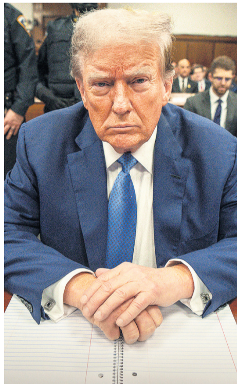
Die Strafverfahren gegen ihn hat Donald Trump nicht vergessen.

Etwa ein pensionierter Offizier der US-Armee, der bekannte, er habe noch am Wahlabend den Koffer gepackt. Weil seine Vorfahren aus Italien eingewandert waren, bemüht er sich jetzt um die italienische Staatsbü-