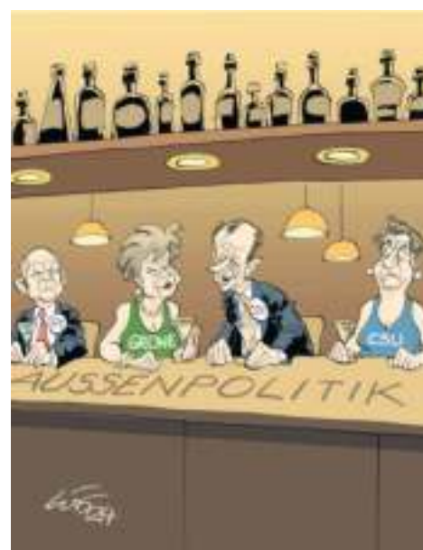
Flirt am Tresen