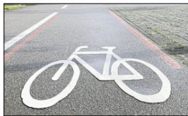
Die AfD beantragte, kein Geld mehr in Radwege zu investieren.