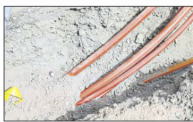
Glasfaser-Leitungen versprechen rasant schnelles Internet.