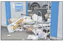
Ärgerliche Zustände.