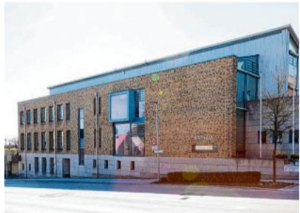
Der Gemeinderat unterstützt zwei Musikvereine.