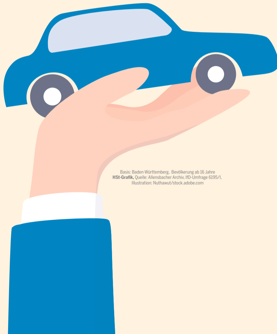
Basis: Baden-Württemberg, Bevölkerung ab 16 Jahre HSt-Graphic, Quelle: Allensbacher Archiv, ID-Umfrage 6195/1, Illustration: Nuthawut/stock.adobe.com

Mit der Angst vor dem Arbeitsplatzverlust wächst bei den Menschen auch die Sorge vor Wohlstandseinbußen. So befürchten aktuell 28 Prozent der Befragten eine Verschlechterung ihrer materiellen Situation in den kommenden fünf Jahren. Im Mai 2025 lag dieser Anteil noch bei 16 Prozent. 22 Prozent der Baden-Württemberger rechnen damit, dass es ihnen in fünf Jahren wirtschaftlich besser gehen wird. Bemerkenswert sind hier die Unterschiede in den Altersgruppen. Während nur zehn Prozent der 60-Jährigen und Älteren davon ausgehen, dass es ihnen in fünf Jahren materiell besser gehen wird, sind es bei den 16- bis 29-Jährigen 49 Prozent.