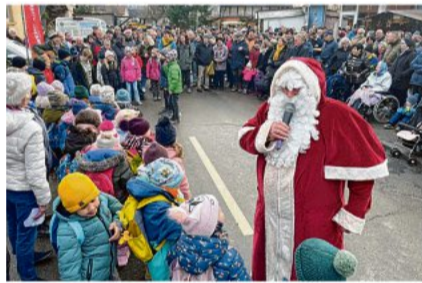
Der Landwehr-Nikolaus, umringt von seinem Volk

Rot am See. Ein Nikolaus, der klingt wie Reiner Groß; dazu Tiere, Kinder, Gewerbe, weihnachtliche Buden und gutes Essen – das waren gestern wieder die beliebten Viehmarkt-Zutaten in Brettheim. Gemeinden Seite 16