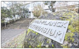
Das Max-Planck-Gymnasium.