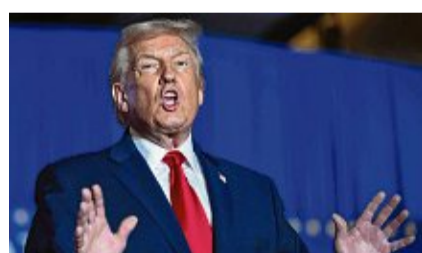
US-Präsident Donald Trump kritisiert wiederholt die Energiepolitik Europas.

München Die neue Grundsteuer ist nach Überzeugung des Bundesfinanzhofs (BFH) nicht verfassungswidrig. Die Münchener Richter wiesen am Mittwoch drei Klagen als unbegründet ab. Eine Vorlage an das Bundesverfassungsgericht komme nicht in Betracht. Die neue Grundsteuer wird seit Jahresbeginn erhoben. Auf dem Prüfstand des BFH stand zunächst das sogenannte Bundesmodell, das in elf der 16 Bundesländer genutzt wird. Die Länder Hamburg, Niedersachsen, Hessen, Baden-Württemberg und Bayern haben eigene Regelungen getroffen, die auf die Fläche oder den Bodenwert abstellen. Auch dagegen sind noch Klagen beim BFH anhängig. (AFP)