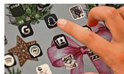
Eine Hand tippt auf einem Bildschirm das Snapchat-Symbol an.