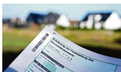
Eine Erklärung zur Feststellung des Grundsteuerwerts für 2025.

Kommentar: „Riesige Aufgabe“ Einblick: Das bereitet den Menschen Sorge