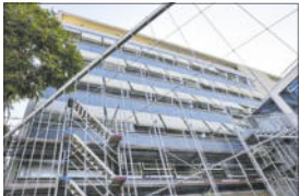
Baustelle Landratsamt.