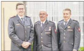
Die neuen Kommandanten der Feuerwehr Welzheim.