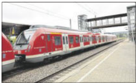
S-Bahn am Bahnhof Winnenden.